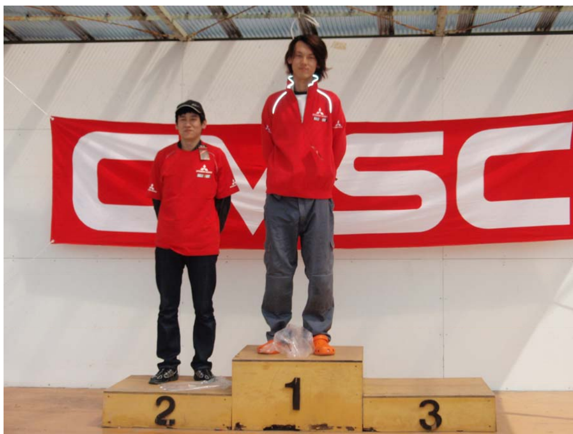
(ラリーアート2駆部門の表彰)