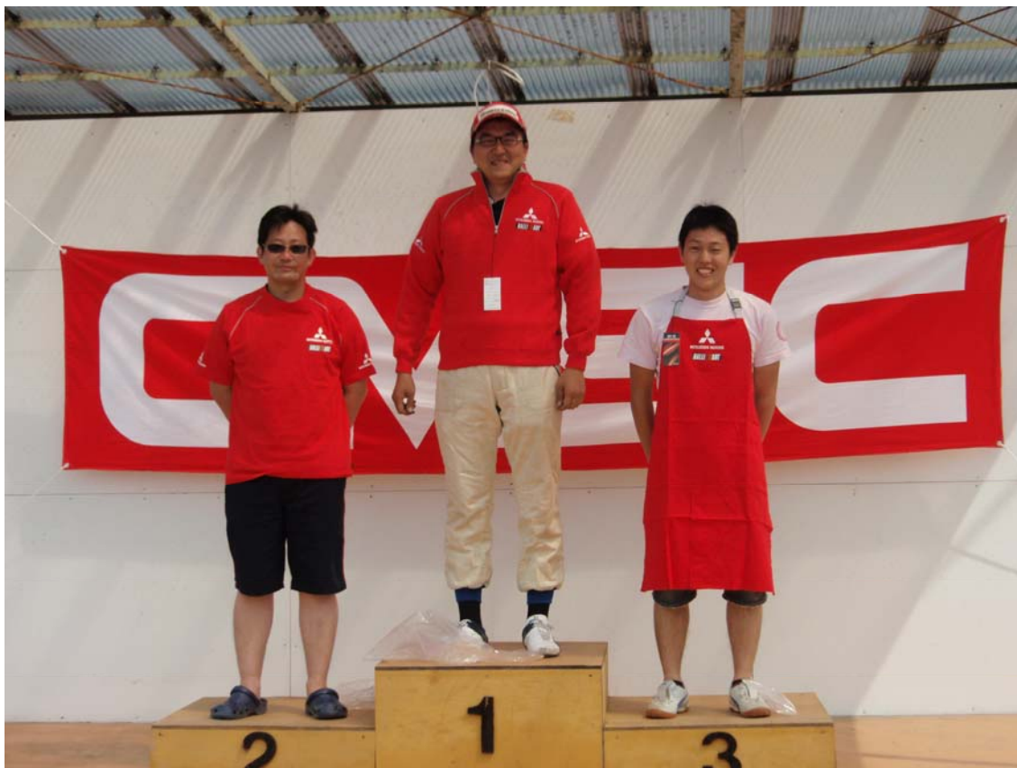
(ラリーアート4駆部門の表彰)