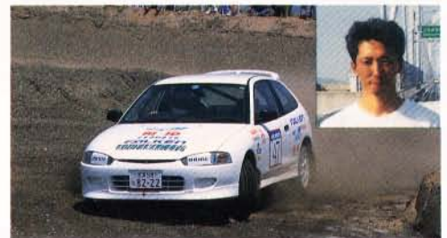
今後が楽しみな相原選手。