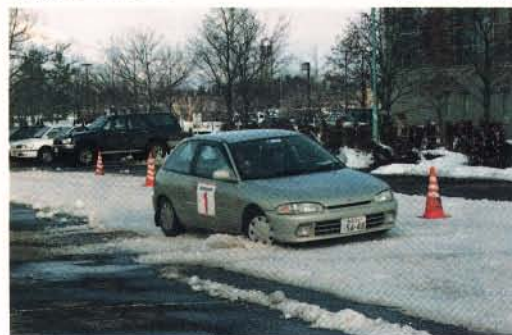
地域の活動にも貢献。

が、お互いに楽しい一日でした。セミナーの様子は翌日の地元紙にも掲載されました。(CMSC青森 伴 英憲)