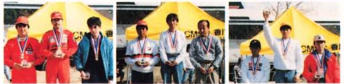
左からAII・AIII・AIVの表彰。

松原選手(CMSC香川)が入り、新型ミラージュが上位を独占。AIIIでは、旧々型ミラージュ4WDが3位に入る大健闘。今年からのクラス変更で、車種がバラエティーに富んだシリーズ戦になりそうです。(CMSC香川 白井 修)