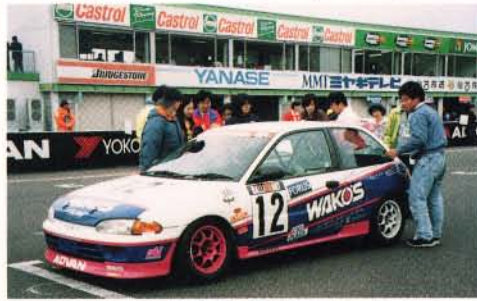
高橋車と喜びのシャンパンシャワー。

きます。コーナーではリードしてもストレートでは差を詰められます。大事にレースを運び、結果1位でゴール。初めての優勝を獲得しました。SUGOのコースレ