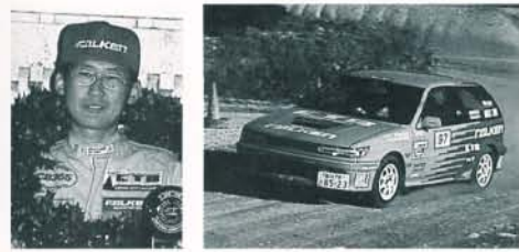
AIIIクラス/大阪/藤原雄一郎 3位 (全日本1位)