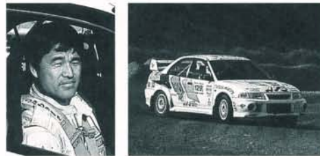
AIVクラス/栃木/赤羽政幸 4位 (C地区1位/全日本8位)