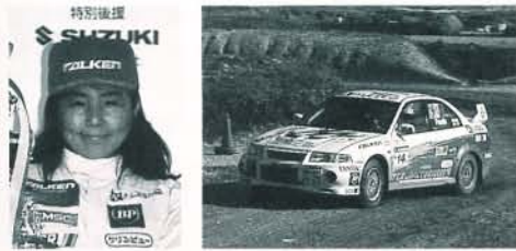
特別後援 SHUZZUKI LIIクラス/座間/小出久実子 4位 (全日本2位)