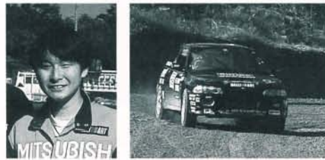
CIHクラス/福島/大泉 剛 15位 (B地区2位)