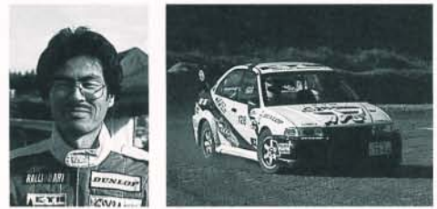
AIVクラス/大阪/吉村 修 12位 (E地区1位/全日本9位)