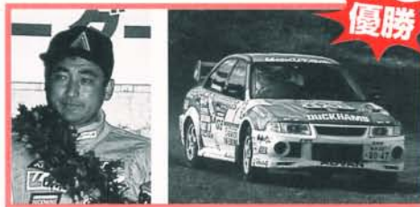
AIVクラス/札幌/宝田芳浩 優勝 (全日本2位)