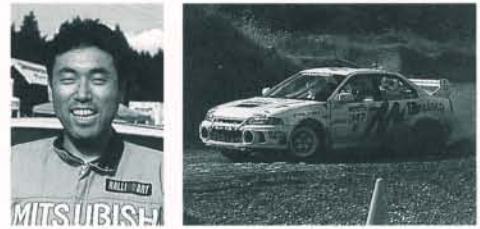
CIHクラス/座間/秋間忠之 11位 (C地区1位)