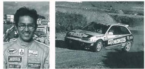
Dクラス/岐阜/栗本利也 11位 (D地区4位)