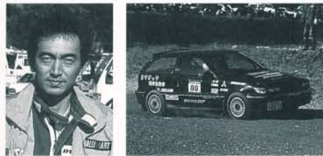
AIIIクラス/福島/斎藤千尋 8位 (B地区1位)