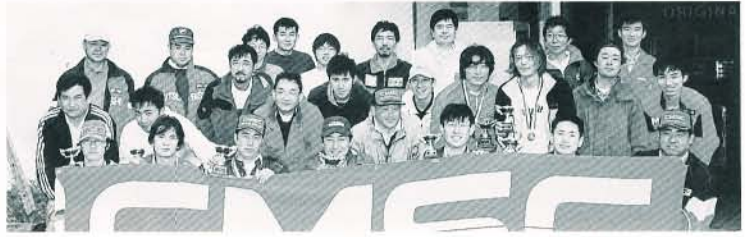
雨の中ががんばった選手、オフィシャルの面々