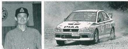
第3戦 7位 / 第4戦 5位(写真) / 第5戦 10位