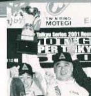
第2戦 2位 / 第3戦 4位 第4戦 優勝(写真)