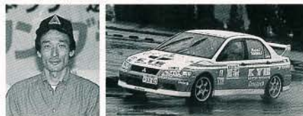
第3戦 4位(写真) / 第5戦 7位