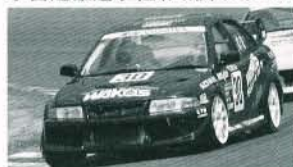
第3戦 3位(写真) / 第4戦 4位