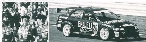
第2戦 5位 / 第3戦 2位(写真) / 第4戦 5位