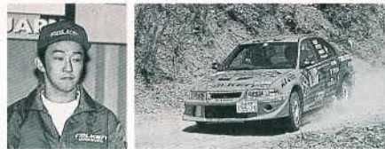
第3戦 9位 / 第4戦 6位(写真) / 第5戦 4位